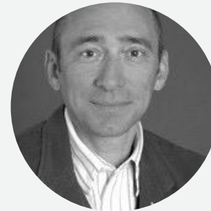
Denis Hennequin / / Ex-PDG Europe McDonalds / Ex-PDG Accor